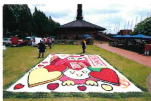
(参考:野木町煉瓦窯3周年感謝祭時 完成品)

国指定重要文化財「野木町煉瓦窯」の前に広がる花絵アート。カーネーションの花びら等で野木町のマスコットキャラクター「のぎのん」を描きます。